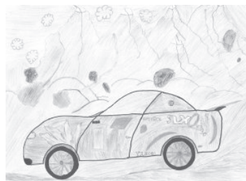
4. miesto - Radovan Forgáč