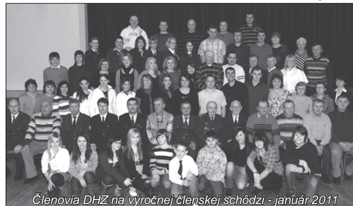
Členovia DHZ na výročnej členskej schôdzi - január 2011