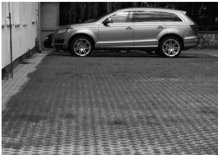
Parkovacia plocha pred Zdravotným strediskom

Priestor na stretnutia s priateľmi v letných dňoch bude vytvorený v areáli PZ pod názvom „Hudobné leto“, kde sa v