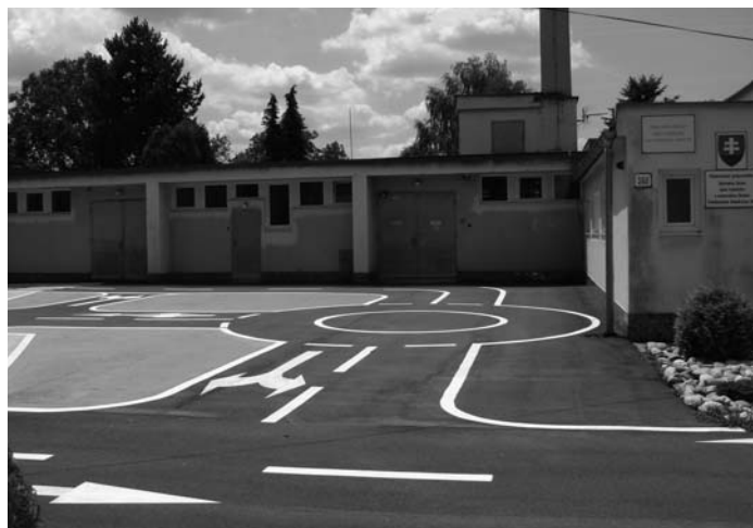
Dopravné ihrisko v materskej škole

Priestor na stretnutia s priateľmi v letných dňoch bude vytvorený v areáli PZ pod názvom „Hudobné leto“, kde sa v