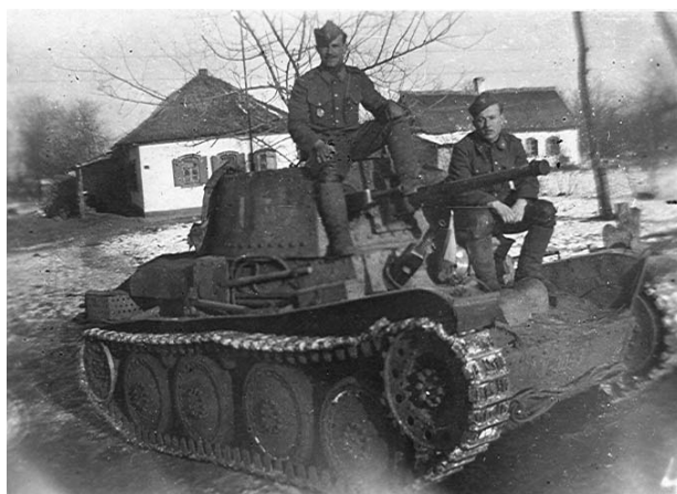
Slovenskí vojaci na Kaukaze

Matrika zosnulých v Trenčianskych Stankovciach.