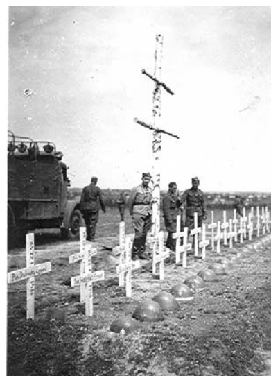
Cintorín v Lipovci