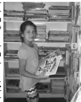
Leto v knižnici