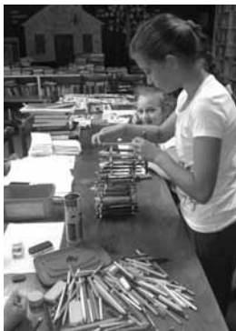
Leto v knižnici