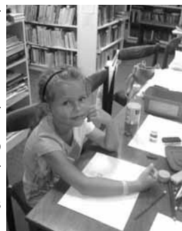
Emke z Trenčína sa v našej knižnici páči