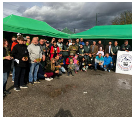
Výhodnotenie LaugaricioCup 2023