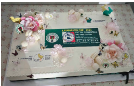
Torta Laugaricio Cup 2023 dar od Estonskeho spolku

V súvislosti s našim technickým zabezpečením neustále prechádzame obdobím úprav skladových a prevádzkových priestorov pre našu činnosť a výstavu pri školskom dvore.