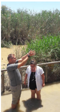
Krst v rieke Jordán – púť do Sv. zeme máj 2019