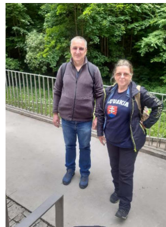
Výlet – priepasť Macocha 2023