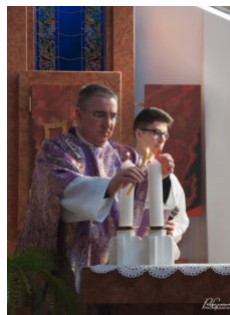
Posvätenie oltára v kostole PMPK v Trenčianskych Stankovciach 4.3.2018

Prvotný šok z jeho nečakaného odchodu odznel, ale prázdne miesto po ňom v našej farnosti a smútok za ním pretrváva stále. Veď za viac ako desať rokov pastoračnej služby v našej obci Trenčianske Stankovce sa nezmazateľne zapísal do našich životov. Každý, koho sobášil, krstil mu