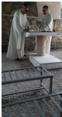
Sv. omša v Betleheme – púť do Sv. zeme máj 2019